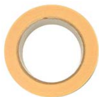
ドラフティングテープ