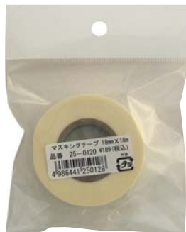
マスキングテープ